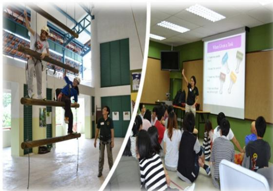
拓展合作：多层挑战，勇于突破自我