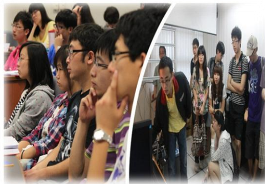
学习访问：创新内容，过程精彩无限