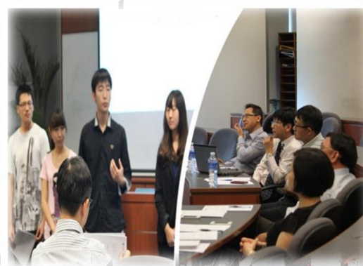
比赛实践：实战演练，积累宝贵经验