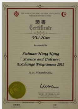
香港理工大学结业证书