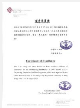
香港理工大学推荐信